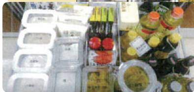
調理台への 収納例

「保存食」を長期保存しておくのではなく、「普段使う食品」を多めに購入しておき、使ったらその分を補充し、常に食料を確保しておくという考え方です。