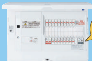
地震あんしんばん