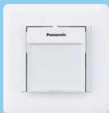
明るさセンサ付 ホーム保安灯