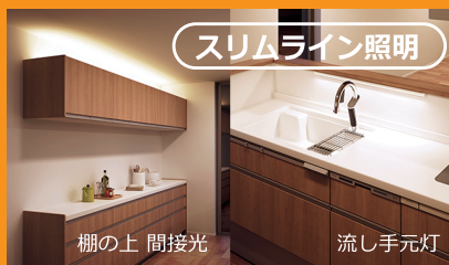
スリムライン照明

「スリムライン照明」は間接照明のようなものですが、とても薄いので、多少奥行のある棚の上などでしたら幕板(隠すための板)がなくても照明本体が見えずスッキリ!スタイリッシュな仕上がりに! →