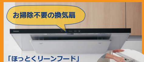
お掃除不要の換気扇