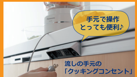
手元で操作 とっても便利!